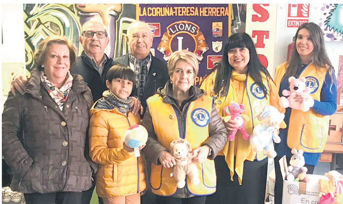
Entrega de alimentos, juguetes y productos de higiene a la Asociación Renacer del Dr. Pernas y Cascos.

La Fundación Meniños lucha para que todos los niños puedan tener una familia